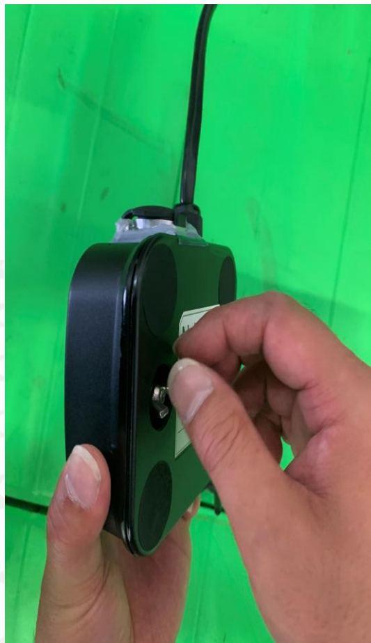
2 後ろのネジを回してください