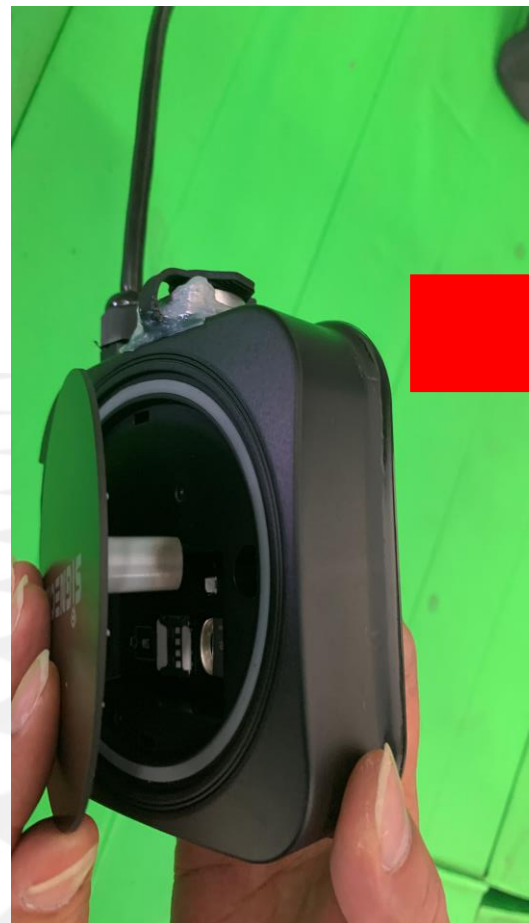
3 後ろのネジを押してブタ外します