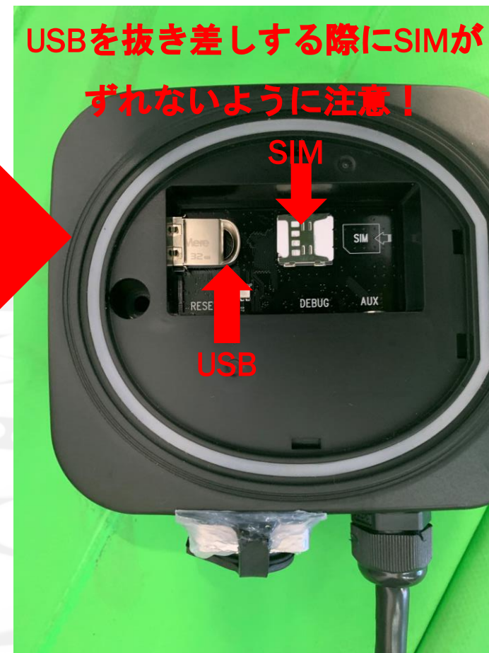
4 USBを交換してください

USBの交換後、サインエージを再起動すると、サーバー上の映像は自動的にダウンロードされます。ダウンロードの矢印が消えるまでお待ちください。