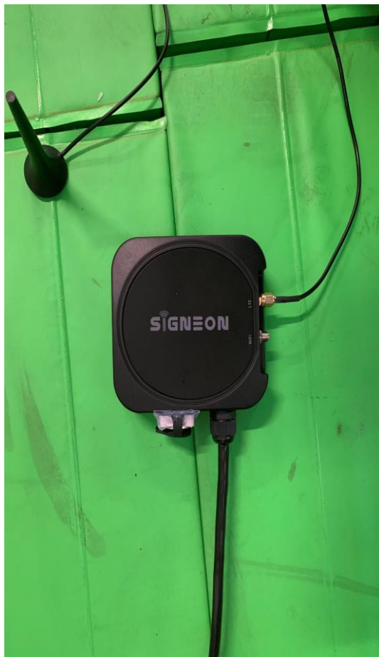
1 コントローラーを準備